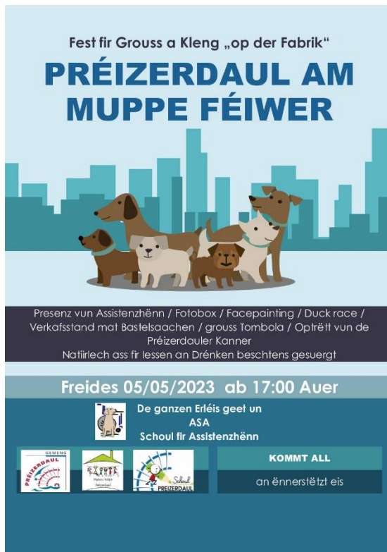
Gemeng Préizerdaul, 2023

Une autre action a été lancée par le Paarverband de Schifflange qui a pu récolter la somme de 8.750.-€ dont la remise du chèque a eu lieu le 9 juillet 2023. Merci pour ce geste !